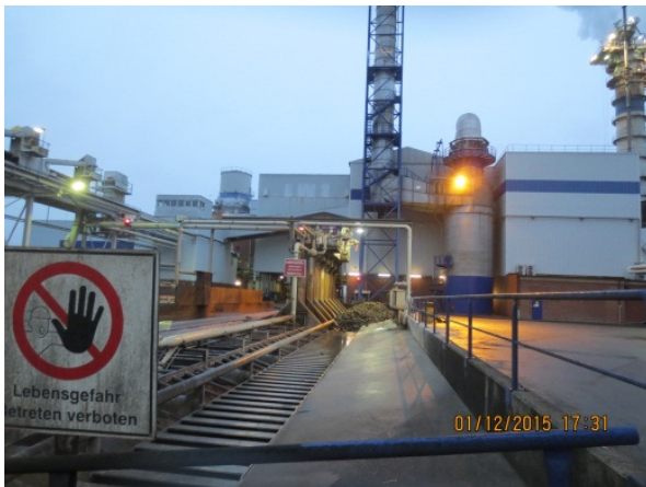
Nassentladung der angelieferten Zuckerrüben.