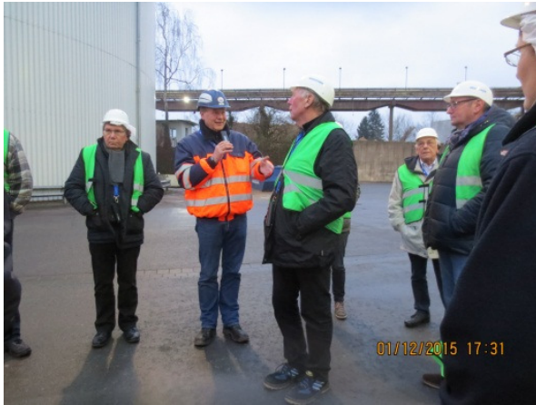
Vor dem Eingangstor zum Betriebsgelände.