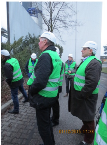
Bei der Werksbesichtigung.