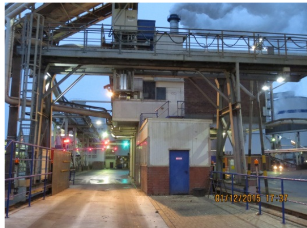
Probenahmestelle für angelieferte Zuckerrüben.