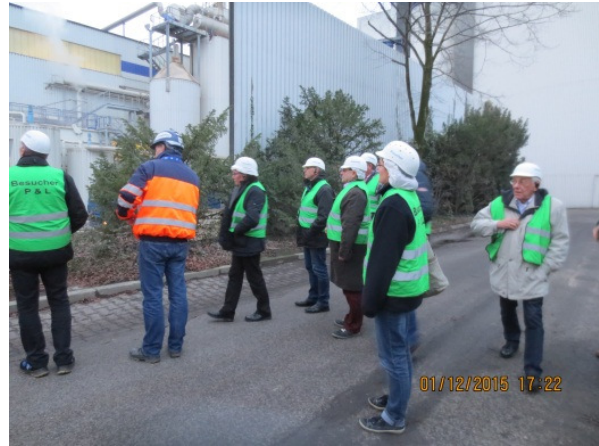
Führung über das Werksgelände.