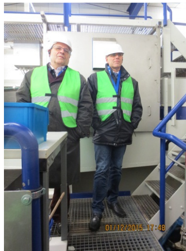
In der Probenahmestation.