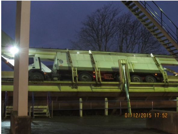
Entladung der Zuckerrüben durch Kippen der LKW.